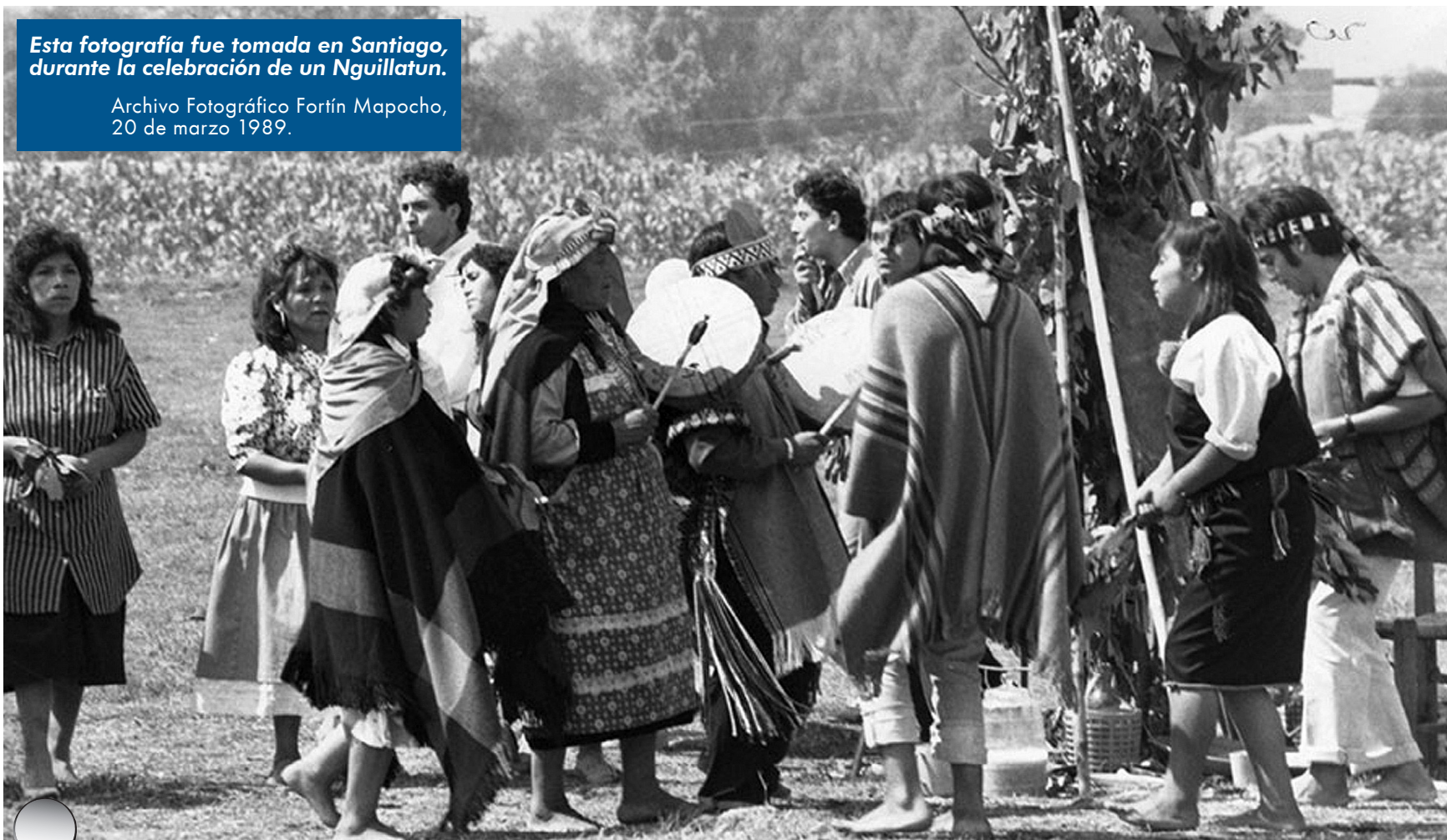
Nguillatun: ceremonia de rogativa, para buena cosecha, salud y otras necesidades cotidianas del pueblo mapuche.

20 de marzo 1989.